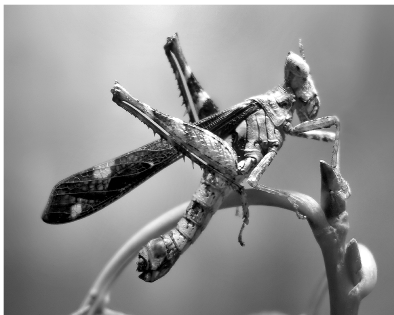
Рис. 1. Внешний вид самца Erianthus versicolor Brunner из Таиланда, о. Ко Кут